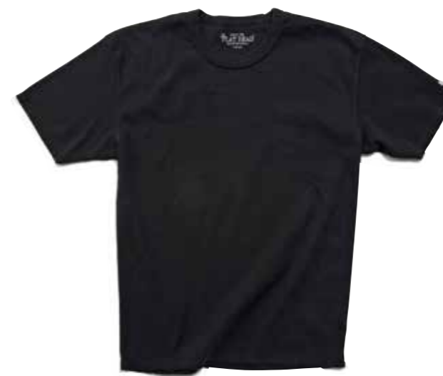
FRAISE S/S T-SHIRT F-TFC-101 ¥8,800 SIZE:S/M/L/XL COLOR:ホワイト/ブラック

袖口や裾の開口部をカットし、ヴィンテージのフラットシーマシンの4本針の平縫いを施すことで、 すっきりとした見た目と肌へのストレスの軽減を実現した「TFC」。このアイデアはフラットヘッドの特許でもある。 ネックは「3本針の1本外し」。