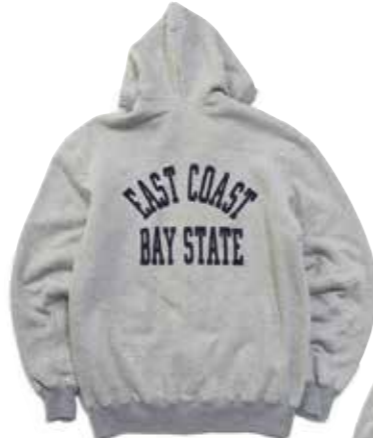
DOUBLEFACE PARKA BAY STATE F-CZP-302 ¥35,000 SIZE:S/M/L/XL COLOR:ブラック/杓グレー/アイボリー