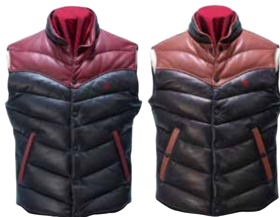
LAMBSKIN DOWN VEST LV102B ¥203,000 SIZE:36/38/40/42 COLOR:ブラック×ブラック / ブラック×ワイン / ブラック×ブラウン ポーランド産のマザーグースを使ったダウンベスト。受注生産。