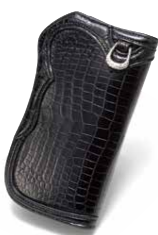
CROCODILE/CORDOVAN SEMI LONG WALLET MK-W011 SP ¥325,000 COLOR:ブラック