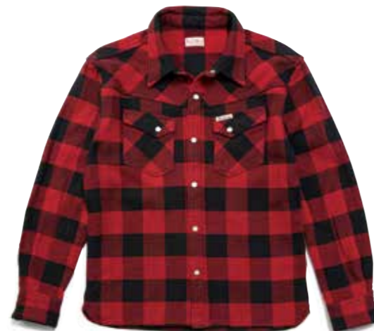
FH BLOCK CHECK L/S F-SNO-301L ¥20,000 SIZE:XS/S/M/L ¥22,000 SIZE:XL/XXL COLOR:ブラック×レッド/ブルーグリーン×レッド/ ターコイズ×ワイン

定番柄として人気の高いブロックチェック柄も、フラットヘッドではオリジナルで製作。ひとつの生地でブロックチェックとヘリンボーンを表現した生地を使っている。