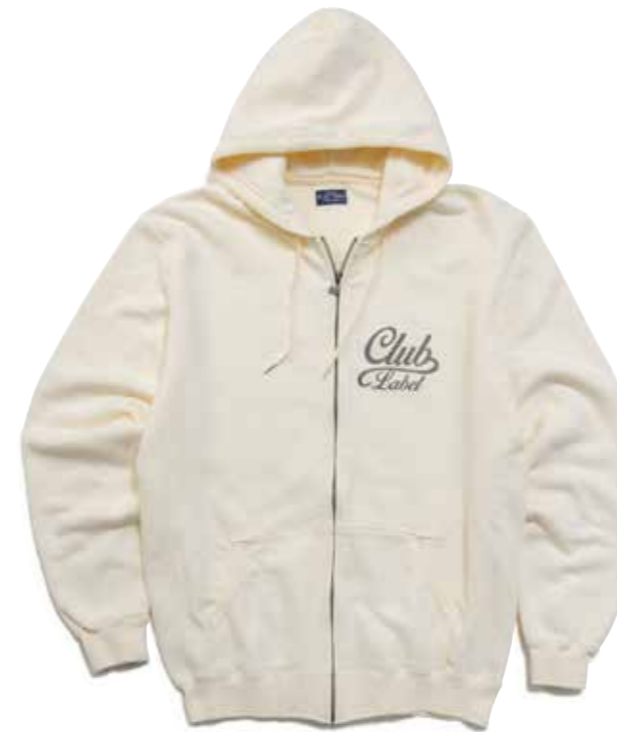
FULL ZIP PARKA CLUB LABEL CL-PZ102 ¥14,800 SIZE:S/M/L/XL COLOR:アイボリー/ブラック/ブラウン 胸にワンポイントのプリントが施されたフルジップパーカーは、気兼ねなく着用できるアメカジの王道アイテム。