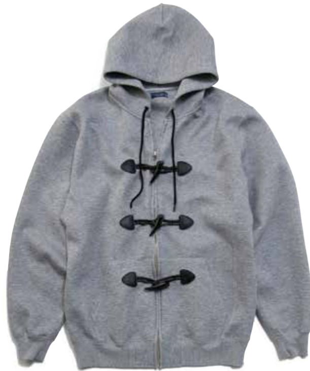
DUFFLE PARKA CL-PO301 ¥18,800 SIZE:S/M/L/XL COLOR:ブラック/グレー ダッフルコートをよりカジュアルに落とし込んだダブルパーカー。フロントジッパーにトグルという個性的なマッチング。