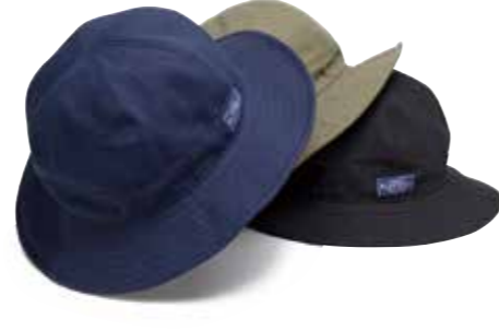
FATIGUE HAT CL-HC101 ¥8,800 SIZE:S/M/L COLOR:オリーブ/ネイビー/ブラック