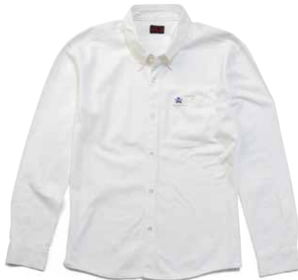
FLAT SEAMER KNIT BUTTON-DOWN L/S

R-SCS-301L ¥25,000 SIZE:XS/S/M/L ¥26,800 SIZE:XL/XXL COLOR:ホワイト/ネイビー