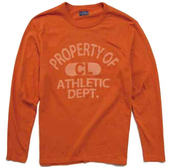
L/S T-SHIRT PROPERTY OF CL CL-TSL002 ¥6,400 SIZE:S/M/L/XL COLOR:ホワイト/ブラック/オレンジ