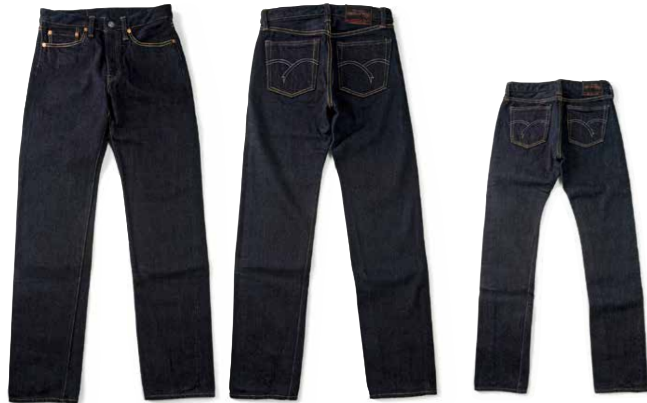
STANDARD STRAIGHT SILK BLEND MK-DP101 ¥50,000 COLOR:ブルー

シルク混の17オンスデニムを使ったスタンダードストレート。ヘビーな17オンスだが、シルクを混ぜることで非常に穿きやすくなっている。ポケットの縫製には耐久性を考慮し、防弾ベストにも使われるザイロン糸を採用している。パッチはウルトラスウェード製。