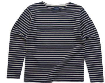
L/S T-SHIRT BORDER BOAT NECK CL-BTL-201 ¥6,800 SIZE:S/M/L/XL COLOR:ホワイト×ブルー/ネイビー×ホワイト/ブラック×グレー