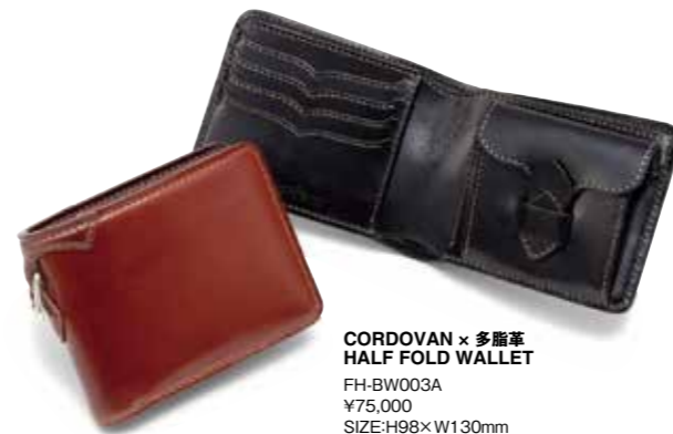
CORDOVAN × 多脂革 HALF FOLD WALLET FH-BW003A ¥75,000 SIZE:H98×W130mm MATERIAL:CORDOVAN×SILVER COLOR:ブラック/ブラウン