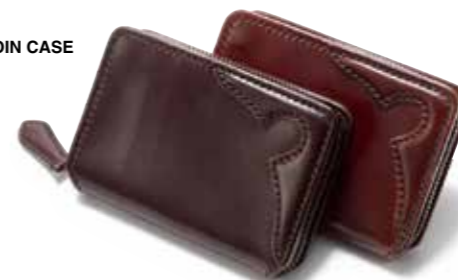
SIZE:H80×W115mm COLOR:ブラック/ブラウン