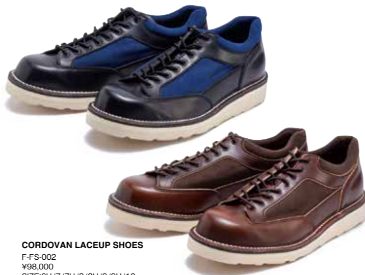
CORDOVAN LACEUP SHOES F-FS-002 ¥98,000 SIZE:6H/7/7H/8/8H/9/9H/10 COLOR:ブラウン/ブラック×ネイビー

木型からオリジナルで製作したモカンブーツ。素材にはステアハイド、履き口にウルトラスウェードを使い履き心地を高めている。モカン部分は熟練職人が一针一針、手縫いで仕上げている。軽量でクッション性の高いEVAソールは長時間履いても疲れにくい。