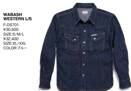
WABASH WESTERN L/S F-DS701 ¥30,500 SIZE:S/M/L ¥32,400 SIZE:XL/XXL COLOR:ブルー

オリジナルのウォッシュデニムを使い、ヴィンテージライクに仕立てられたワークジャケット。主要部分は巻き縫いとトリプルステッチを使い分けている。オリジナルの鉄製ボタン。