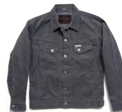
CORDUROY JACKET F-00J-001 ¥28,000 SIZE:S/M/L/XL COLOR:ブラウン/グレー

敵が特徴のコーデュロイ生地を、旧式のシャトル織機で織り上げている。糸に余計なテンションを掛けずに織っているため、風合いと手触りに優れている。