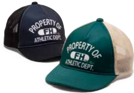
B-B CAP CL CL-HC002 ¥4,800 SIZE:FREE COLOR:グリーン/ブラック