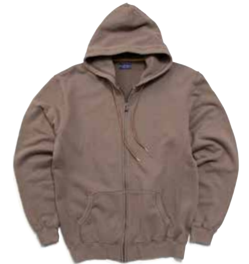
FULL ZIP PARKA CL-PZ101 ¥13,800 SIZE:S/M/L/XL COLOR:アイボリー/ブラック/ブラウン