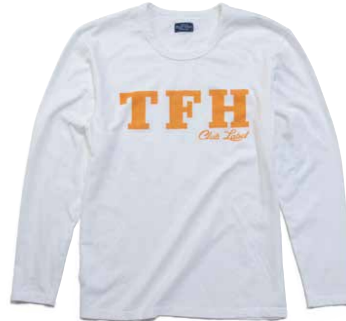
L/S T-SHIRT TFH CL-TSL001 ¥6,400 SIZE:S/M/L/XL COLOR:ホワイト/ブラック/オレンジ