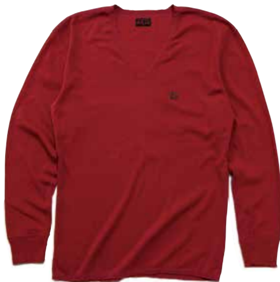
FLAT V-NECK FRAISE L/S

フラットヘッドが特許を取得している「FLAT NECK」。通常のTシャツのネック部にはリブが装着されるが、「FLAT NECK」では開口部を4本針のフラットシーマシンの使うことで、伸びにくく、肌への干渉によるストレスを軽減することに成功した。