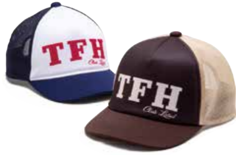
B-B CAP TFH CL-HC003 ¥4,800 SIZE:FREE COLOR:ネイビー×ホワイト/ブラウン