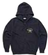
FULL ZIP SWT PARKA FH FLYING WHEEL F-CZP-102LTD(数量限定) ¥18,800 SIZE:S/M/L/XL COLOR:ダークネイビー/杓グレー