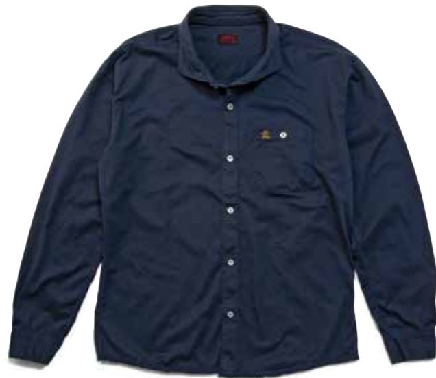
FLAT SEAMER KNIT WIDE SPREAD L/S

一般的なゲージではなく超ハイゲージの編み機で編み立てたコットン100%の生地は、Tシャツのように伸縮性、吸湿性に優れている。 縫製部分の凹凸が少ないフラットシーマシンの使っているため、素肌に着ても快適な着心地。