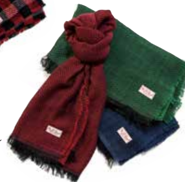
STOLE HERRINGBONE F-SE001 ¥11,000 SIZE:180×60cm COLOR:ブラック×レッド/ブラック×ネイビー/ブラック×グリーン