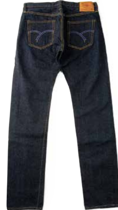
TIGHT TAPERED ZIPPER 3002Z ¥29,600 SIZE:27-34/36/38 ¥31,400 SIZE:40/42/44