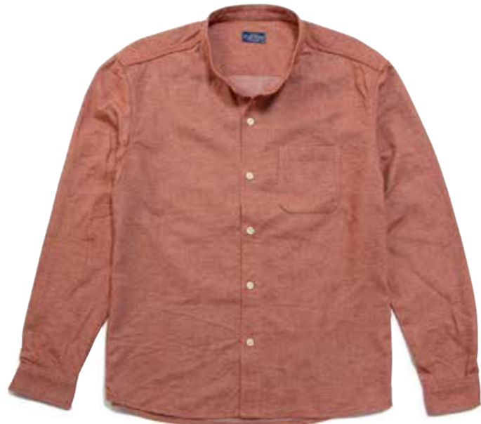
BAND COLLAR SHIRT CL-SH006 ¥16,600 SIZE:S/M/L/XL COLOR:ホワイト/レッド