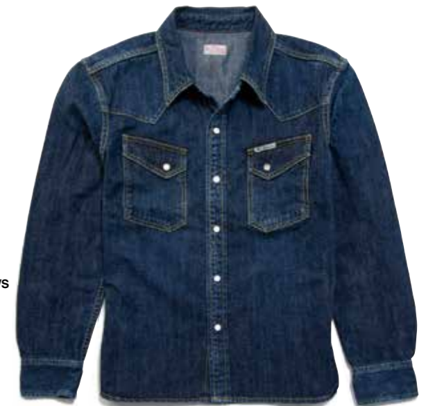
SPECIAL CUSTOM DENIM WESTERN L/S F-DS003C ¥26,800 SIZE:XS/S/M/L ¥28,800 SIZE:XL/XXL COLOR:ブルー