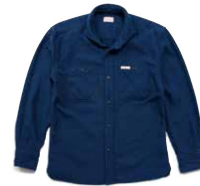
WIDE SPREAD FH HERRINGBONE NEL L/S F-SNO-303L ¥23,000 SIZE:XS/S/M/L ¥25,000 SIZE:XL/XXL COLOR:ネイビー/ワイン

稀少な旧式シャトル織機で織り上げたヘリンボーンの生地は、端にセルビッチを見ることができる。長い期間を掛けて経年変化も楽しめるように、糸の撚り、染色も強化している。