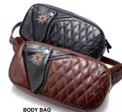
BODY BAG HDB-003 ¥62,900 SIZE:W380×H180×D60mm MATERIAL:HORSE HIDE COLOR:ブラック/ブラウン×ブラック