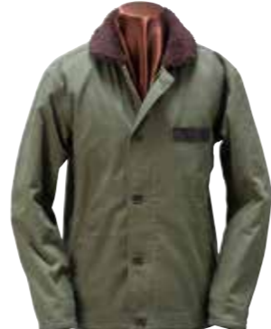
DECK JACKET CL-OJ005 ¥58,000 SIZE:S/M/L/XL COLOR:オリーブ/ネイビー/ブラック

ミリタリーテイスト溢れるデッキジャケット。裏地にフラットヘッドのネル生地、中綿にシンサレートをを使った防寒製の高い1着。