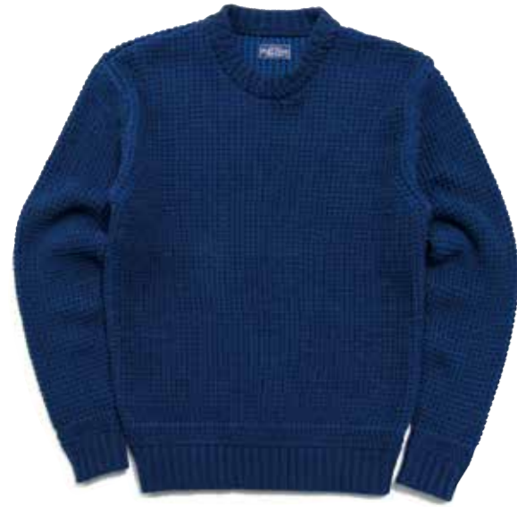
COTTON KNIT CREW NECK CL-KT001 ¥18,000 SIZE:S/M/L/XL COLOR:アイボリー / ブラック / ネイビー×ブルー