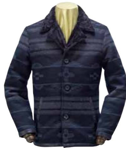
NATIVE PATTERN BLANKET BOA JKT F-OWJ-102A ¥100,000 SIZE:XS/S/M/L ¥110,000 SIZE:XL/XXL COLOR:ブラック×グレー/ブラック×ワイン

保温性の高いウールにドレープ感と光沢を楽しめるカシミアをミックスしたダブルコート。ダブルの特徴であるトグルには、一点一点表情が異なる水牛を使っている。