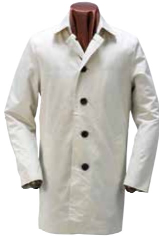
BALMACAAN COAT CL-OC003A ¥53,000 SIZE:S/M/L/XL COLOR:オリーブ/ブラック/ホワイト

コーディネートが広がるシンプルなバルマカンコート。裏地にはフラットヘッドのネル生地。袖口にワンポイント刺繍が入る。