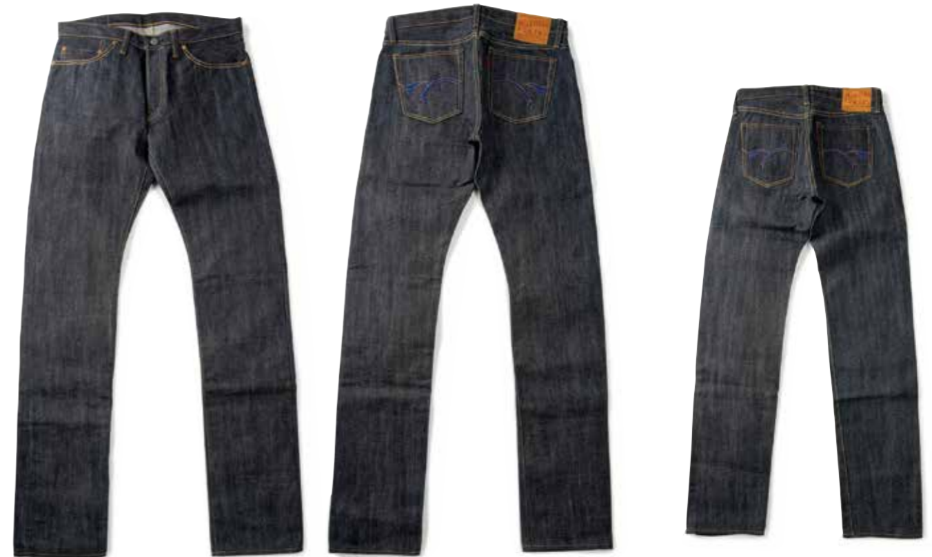
TAPERED FXR ZIPPER

R-TF301L ¥11,100 SIZE:S/M/L/XL COLOR:ホワイト/ブラック/ワイン