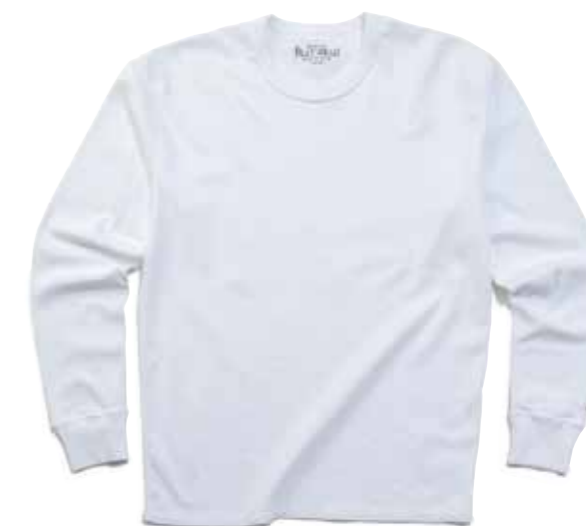
FRAISE L/S T-SHIRT F-TFCL-101 ¥9,800 SIZE:S/M/L/XL COLOR:ホワイト/ブラック