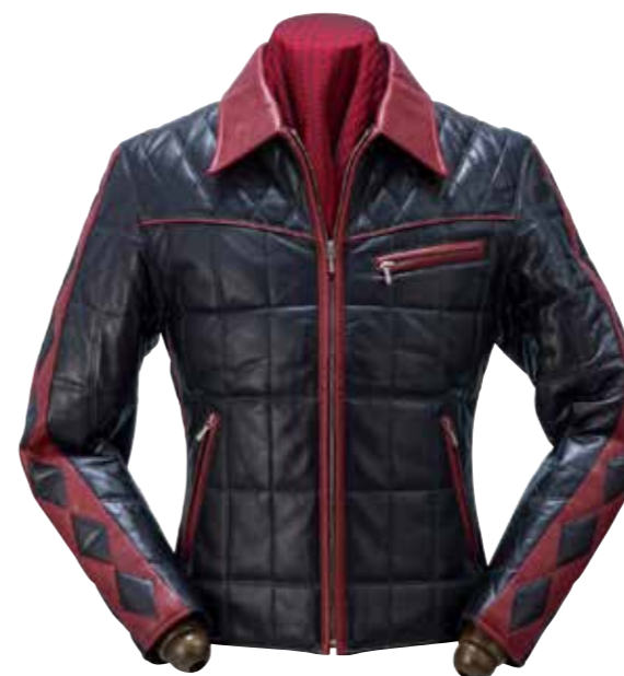
LAMBSKIN QUILTING RIDERS NJ202-SP ¥259,000 SIZE:36/38/40/42 COLOR:ブラック / ブラック×ワイン / ブラック×ネイビー

ポーランド産マザーグースとシンサレートの組み合わせで高い防寒性と保温性を実現した究極のダウンジャケット。ファーには稀少なコヨーテを採用。受注生産。