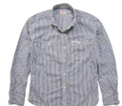
LINEN STRIPE L/S F-SCS-209L ¥22,000 SIZE:XS/S/M/L ¥24,000 SIZE:XL/XXL COLOR:アイボリー×ネイビー/ アイボリー×ブラック

コットンに麻を交えることで、程よいムラ感が現れたストライプ生地によるワイドスプレッドシャツ。軽快な着心地は、1年を通して活躍してくれるはずだ。