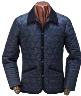
QUILTING COAT CL-OC004 ¥58,000 SIZE:S/M/L/XL COLOR:ブラック/ブラウン/オリーブ

中綿に保温性の高いシンサレートをを使ったキルティングコート。裏地にはフラットヘッドのネル生地を採用。胸にワンポイント刺繍。