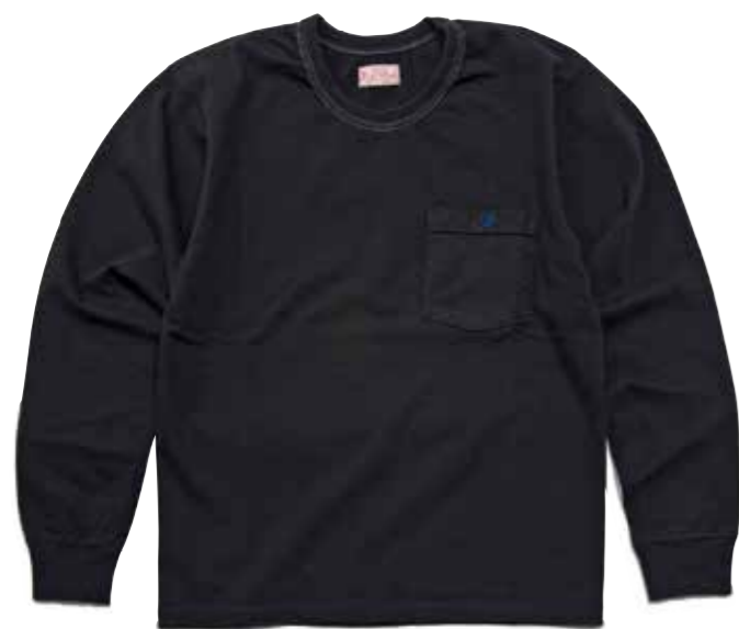
THC LONG SLEEVE F-THCL-201 ¥9,000 SIZE:XS/S/M/L ¥10,000 SIZE:XL/XXL COLOR:ホワイト/ブラック/ネイビー/サックス

フラットヘッドの代表モデルである「THC」を、そのままロングスリーブにした「THCL」。 ボディには質実剛健な度詰めの肉厚コットンを使い、ネックはお馴染みの「3本針の1本外し」による縫製。 ヘビーローテでも長年愛用できるロンTに仕上げられている。