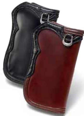
CROCODILE/CORDOVAN SEMI LONG WALLET MK-W011 ¥160,000 COLOR:ブラック / ブラウン