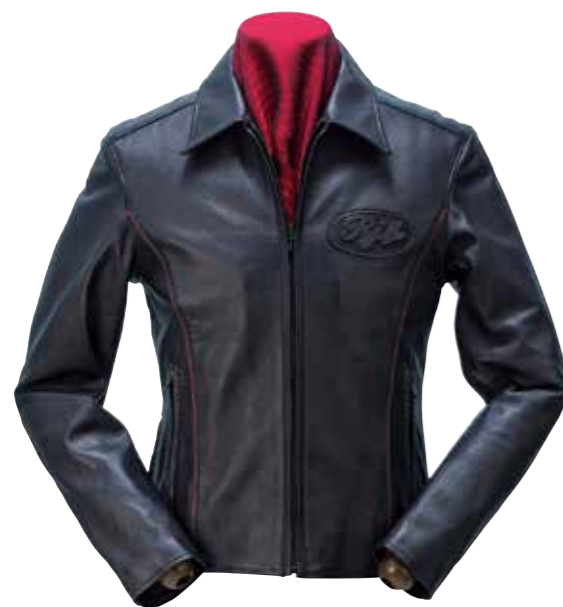
LAMBSKIN JACKET LJ502 ¥231,400 SIZE:34/36/38/40/42 COLOR:ブラック