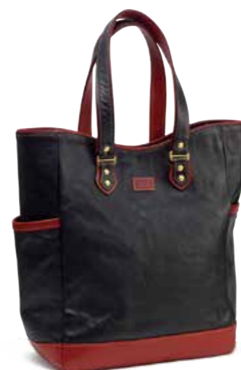
LEATHER TOTE BAG FH-BT005 ¥75,000 SIZE:W300×H380×D130mm MATERIAL:HORSE HIDE COLOR:ブラック×レッド