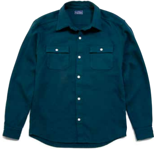
HERRINGBONE SHIRT CL-CWS001 ¥14,800 SIZE:S/M/L/XL COLOR:ベージュ/ブルー