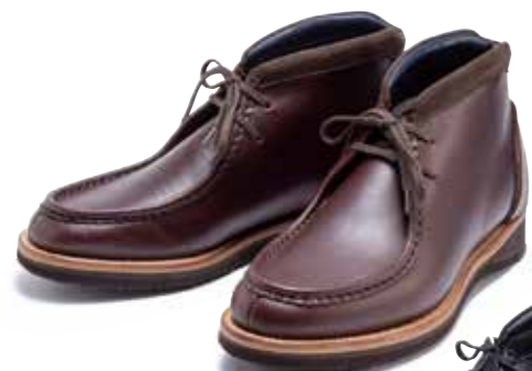
MOCCASIN BOOTS F-FB-005 ¥78,000 SIZE:6H/7/7H/8/8H/9/9H/10 COLOR:ブラウン/ブラック