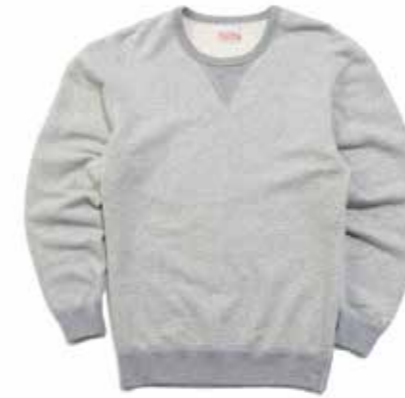
CREW NECK SWEAT F-CSC-101 ¥19,800 SIZE:S/M/L/XL COLOR:ブラック/杓グレー/アイボリー

どんなコーディネートにも合わせやすいシンプルなスウェット。主要部分は稀少なフラットシームで縫製されているため、縫い目がフラットで肌にも優しい。左袖に織りネーム。