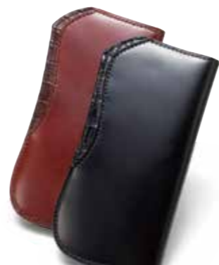
CROCODILE SEMI LONG WALLET TL-W001 ¥58,000 SIZE:H180×W90mm MATERIAL:CROCODILE×CORDOVAN×BOX KIP COLOR:ブラック×ブラック/ブラック×ブラウン/ブラウン×ブラック/ブラウン×ブラウン