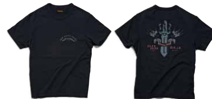
CREW NECK SILK BLEND