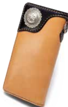
Heritage Series 多脂革 LONG WALLET FH-WL004C ¥63,000 SIZE:H95×W195mm MATERIAL:多脂革×シルバ COLOR:ブラック/タン/ブラック×タン/タン×ブラック