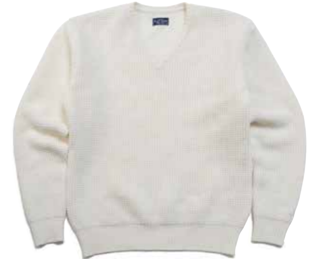
WOOL KNIT V-NECK CL-KT008 ¥21,000 SIZE:S/M/L/XL COLOR:ブルー / グレー / アイボリー