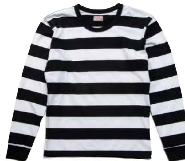
L/S T-SHIRT BORDER A F-BTL-101 ¥8,800 SIZE:S/M/L/XL COLOR:ブラック×ホワイト/ブラック×ネイビー

着用した時にもっとも美しく見えるボーダー幅を割り出し、高度な技術でボーダーの境を美しく仕上げた唯一無二のボーダーT。 「3本針の1本外し」でネック強度を高め、肩やアームホールなどの縫製は、 ステッチとステッチの間を膨らませることで、擦れによる糸切れを低減している。