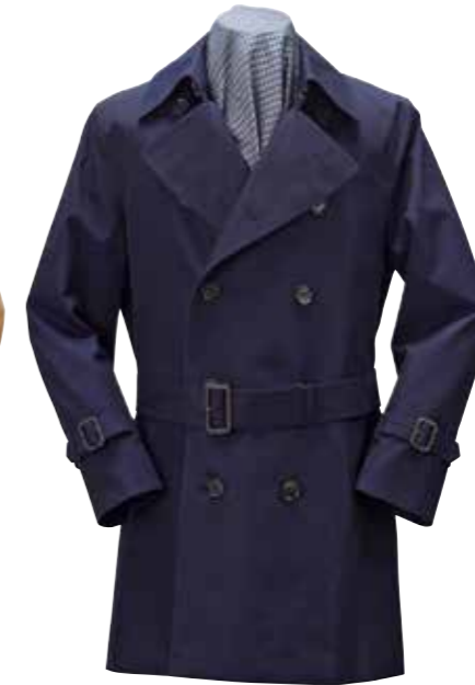
BELTED COAT MK-OC011 ¥118,000 SIZE:S/M/L/XL COLOR:ネイビー/キャメル/ワイン

トレンチコートの伝統的なディテールであるガンフラップやエポレットを省略し、より幅広いコーディネートに対応させたコート。熟練職人による一糸乱れぬステッチ、着脱可能なライニングなど、基本ディテールは定番トレンチを踏襲している。