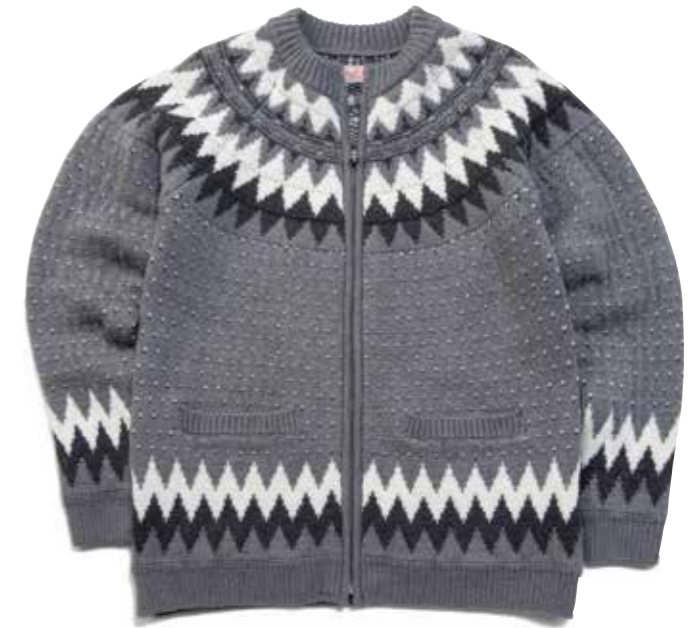
WOOL ZIP CARDIGAN NORDIC PATTERN A F-NWC-103 ¥42,800 SIZE:S/M/L/XL COLOR:ブラック/ホワイト/グレー

イタリアで150年以上の歴史を持つ名門紡績、ゼニアバルファ社のキャッシュウールを使った贅沢なカーディガン。頭を中心として円を描くように編んでいく求心編みによって、縦横ではなく斜め方向に伸縮するため非常に着心地が良い。