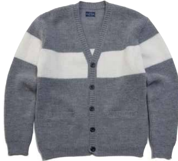
WOOL KNIT BORDER CARDIGAN CL-KC002 ¥24,000 SIZE:S/M/L/XL COLOR:ブルー/グレー/アイボリー