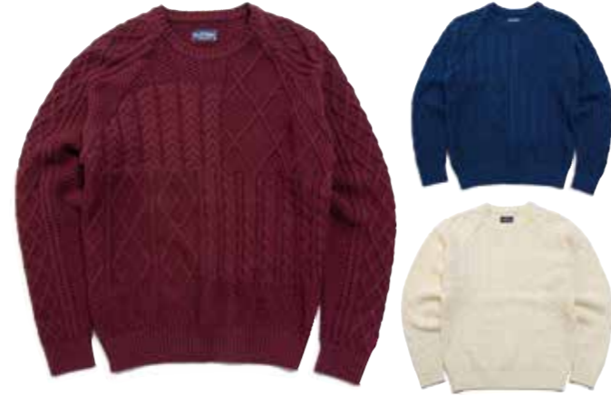
COTTON KNIT RANDOM CABLE CREW NECK CL-KT004 ¥19,800 SIZE:S/M/L/XL COLOR:アイボリー / ネイビー / ボルドー