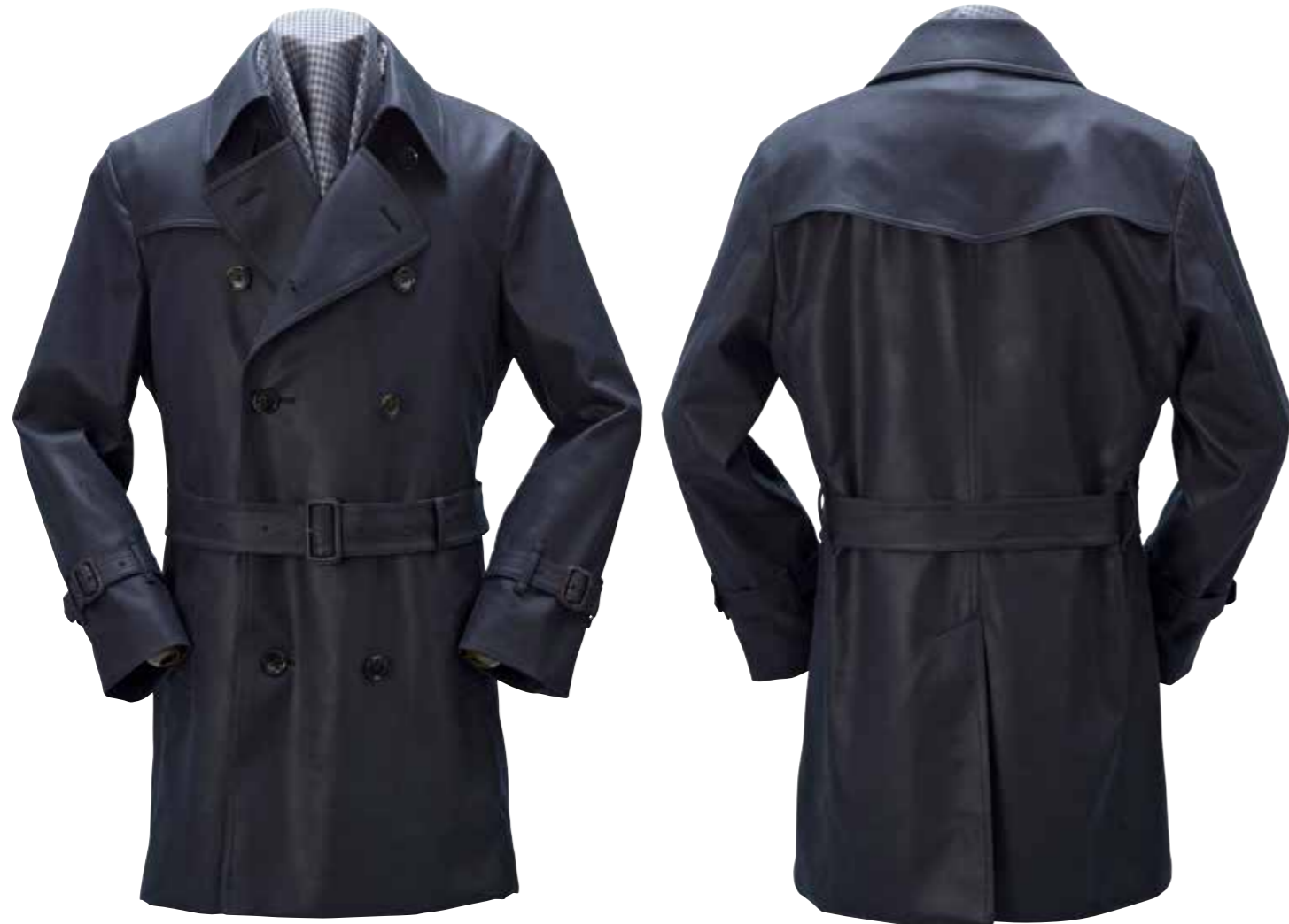
ULTRASUEDE TRENCH COAT MK-OC101 ¥198,000 SIZE:S/M/L/XL COLOR:ブラック

カジュアルスタイルへの取り入れを提案しているトレンチコートを、高級素材として知られるウルトラスウェードで仕立てた1着。ウルトラスウェードは縫製が難しい素材のため1着の衣類に仕立てられることは珍しいが、数々のコートを手掛けてきた熟練職人の手によりコートに仕立てることに成功。極上の肌触りと抜群のドレープ感を存分に楽しんで頂きたい。