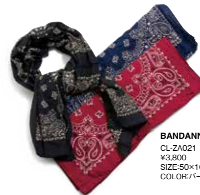
BANDANNA STOLE CL-ZA021 ¥3,800 SIZE:50×160cm COLOR:バーガンディ/ネイビー