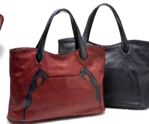
LEATHER TOTE BAG STB-001 ¥118,500 SIZE:W460×H320×D140mm MATERIAL:OIL SHRINK LEATHER×CORDOVAN COLOR:ブラック/レッド