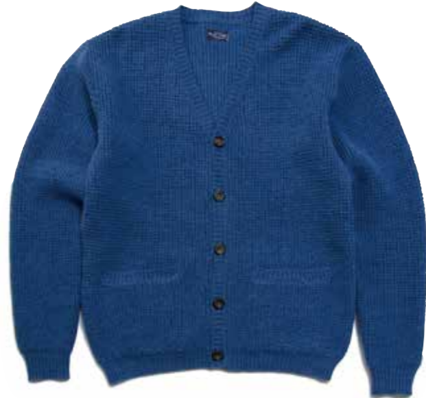
WOOL KNIT CARDIGAN CL-KC001 ¥22,000 SIZE:S/M/L/XL COLOR:ブルー/グレー/アイボリー