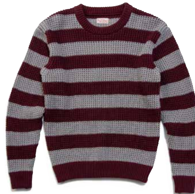
COTTON KNIT BORDER CREW