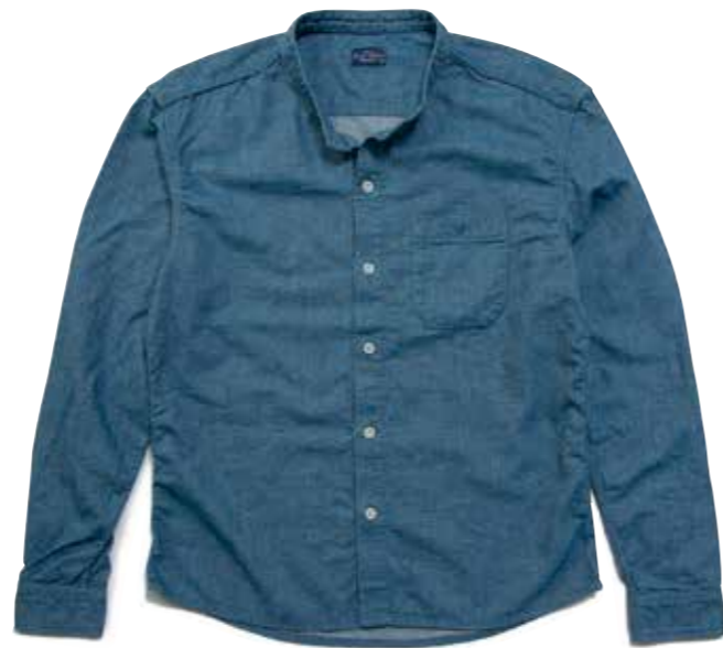
BAND COLLAR SHIRT CL-SH001 ¥16,800 SIZE:S/M/L/XL COLOR:ホワイト/ネイビー