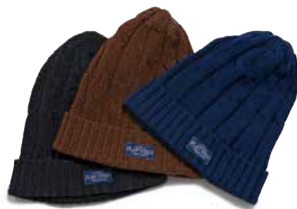
COTTON KNIT CAP CL-HC004 ¥4,800 SIZE:FREE COLOR:ブラック×チャコール/ネイビー×ブルー/ブラウン×ダークブラウン