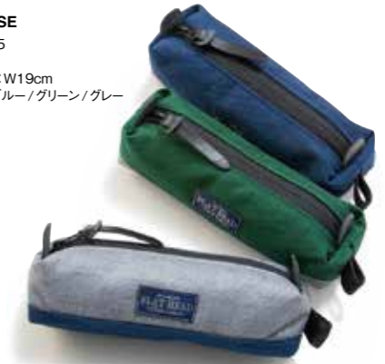
PEN CASE CL-BA005 ¥2,600 SIZE:H5×W19cm COLOR:ブルー/グリーン/グレー