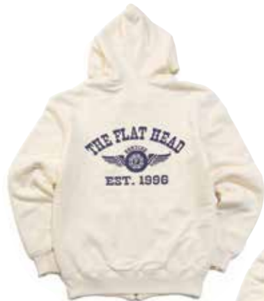
DOUBLEFACE PARKA FH FLYING WHEEL F-CZP-301 ¥35,000 SIZE:S/M/L/XL COLOR:ブラック/杓グレー/アイボリー

表地には旧式の吊り編み機でゆっくりと空気を含みながら編み込まれたスウェット生地。 ライニングにはフラットヘッドのサーマル生地を使ったダブルフェイス仕様。 縮率が異なる生地を高度な技術で1枚のパーカーに仕立てている。保温性が高く、ライトアウターとしても活躍してくれる。