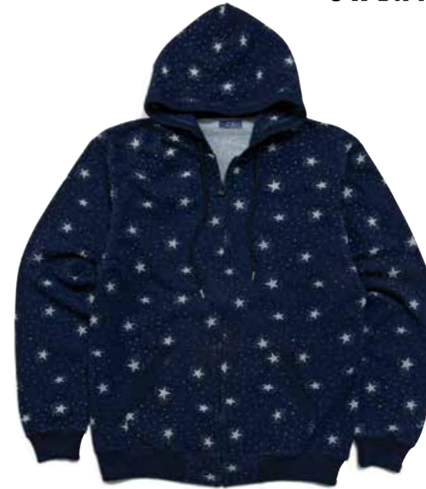
INDIGO SWEAT ZIP PARKA CL-PZ201 ¥14,800 SIZE:S/M/L/XL COLOR:ブルー ローブ染色で染めた糸を使って編み立てたインディゴニットは、着込む程に経年変化を楽しむことができる。