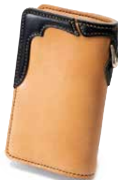
多脂革 MEDIUM WALLET FH-WS014 ¥55,000 SIZE:H155×W100mm MATERIAL:多脂革×SILVER COLOR:タン×ブラック