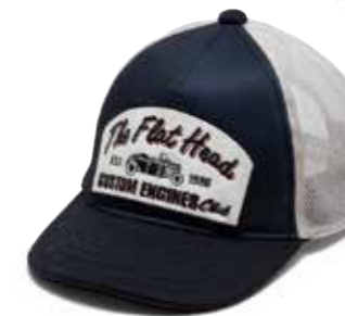
FH MESH CAP CUSTOM ENGINE F-HC-112 ¥7,000 SIZE:FREE COLOR:ブラック