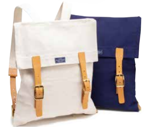
DAY PACK CL-BA102 ¥15,800 SIZE:H35.5×W40.6cm COLOR:アイボリー/ネイビー