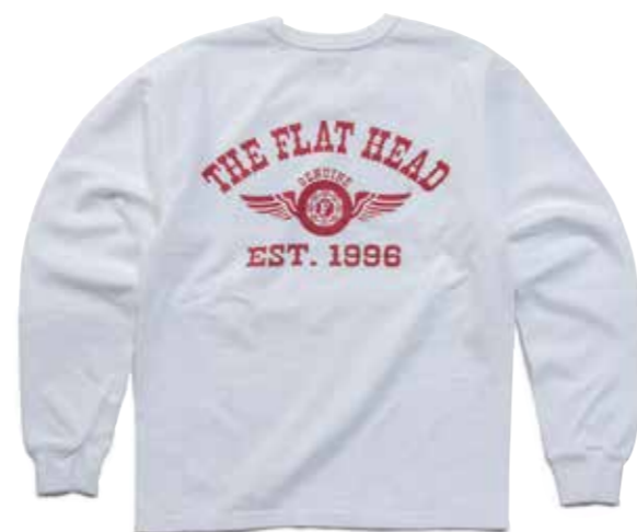
THC LONG SLEEVE FH FLYING WHEEL F-THCL-205 ¥10,000 SIZE:XS/S/M/L ¥11,000 SIZE:XL/XXL COLOR:ホワイト/ブラック/ ネイビー/サックス