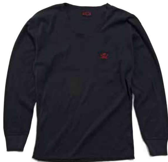
FLAT CREW-NECK FRAISE L/S

R-TV301L ¥11,100 SIZE:S/M/L/XL COLOR:ホワイト/ブラック/ワイン