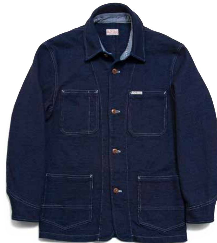
INDIGO KNIT COVERALL F-OOJ-002 ¥38,000 SIZE:S/M/L/XL COLOR:ブルー

デニムの醍醐味である経年変化による色落ちを楽しめるように、芯白を残すローブ染色で染め上げた糸を使ったニットデニム。 伸縮性に富んだ編み組織で仕上げているので、柔らかな着用感と風合いを堪能できる。 常に新しい提案を目指すフラットヘッドらしい素材だ。