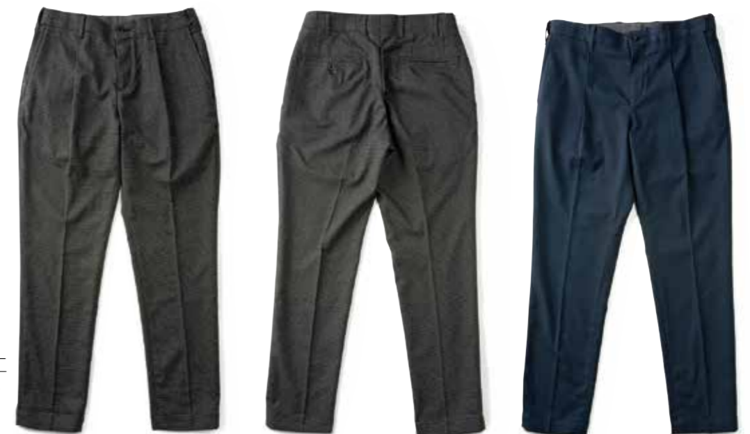
GREEN CHECK PANTS

D110FXRZ ¥31,400 SIZE:26-34/36/38 ¥33,300 SIZE:40 COLOR:ブルー