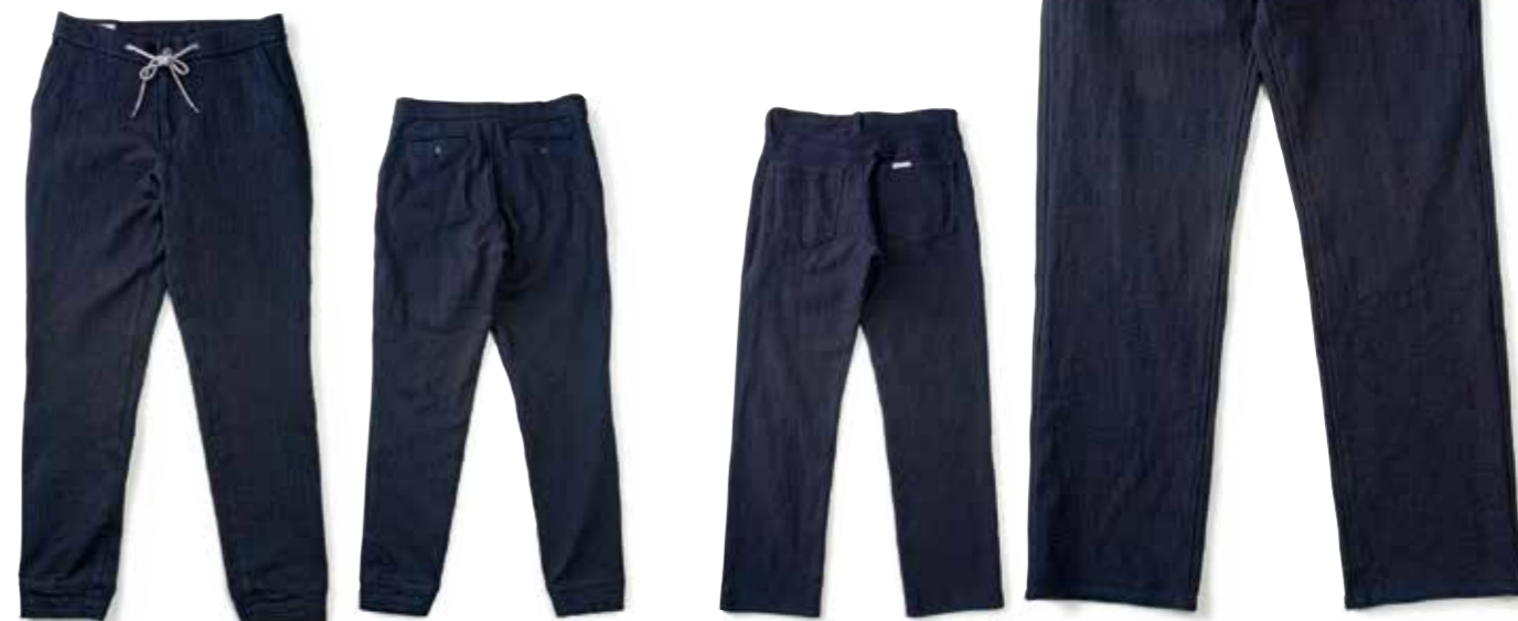
INDIGO KNIT JOGGERS F-DN002 ¥28,000 SIZE:S/M/L/XL COLOR:ブルー

定番のカバーオールもニットデニムなら驚くほどソフトな着心地となる。非常に軽量でストレスフリー。一度羽織れば病み付きになること間違いなし。