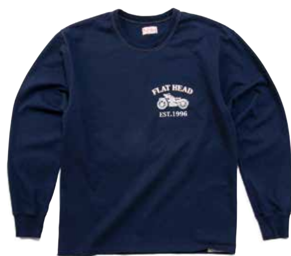
THC LONG SLEEVE SEE YOU ON THE ROAD F-THCL-208 ¥10,000 SIZE:XS/S/M/L ¥11,000 SIZE:XL/XXL COLOR:ホワイト/ブラック/ ネイビー/サックス