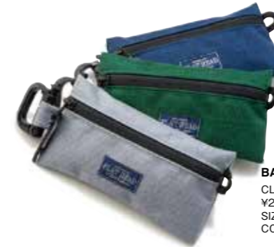
BAG IN BAG SMALL CL-BA004 ¥2,800 SIZE:H9.5×W17cm COLOR:ブルー/グリーン/グレー