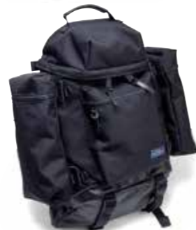
BACK PACK CL-BA001 ¥29,000 SIZE:H50×W35×D18cm COLOR:ブルー/ブラック/ブラウン