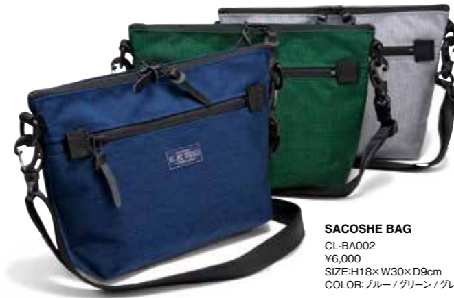
SACOSHE BAG CL-BA002 ¥6,000 SIZE:H18×W30×D9cm COLOR:ブルー/グリーン/グレー