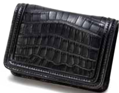
CROCODILE/CORDOVAN CARD CASE MK-V011 ¥90,000 COLOR:ブラック