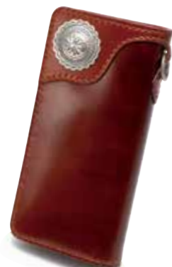
Heritage Series CORDOVAN LONG WALLET FH-WL003C ¥110,000 SIZE:H95×W195mm MATERIAL:CORDOVAN×SILVER COLOR:ブラック/ブラウン/ブラック×ブラウン/ブラウン×ブラック