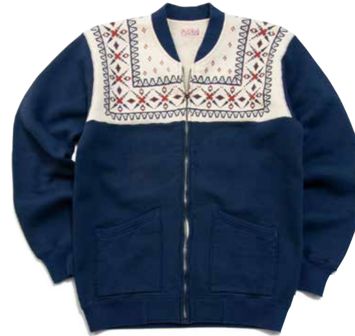
FULL ZIP SWT JKT SNOW PATTERN F-CZR-102 ¥25,000 SIZE:S/M/L/XL COLOR:ブラック/ネイビー/グレー

肩の部分にハギがなく1枚で仕立てられたスノーパターン部を、高度な技術で縫製したフルジップ仕様の雪柄スウェット。柄の見え方にこだわったディテールである。