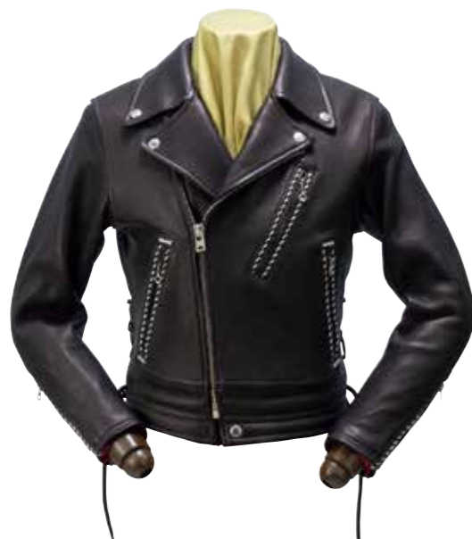
DEER SKIN RIDERS JKT F-DWJ001 ¥240,000 SIZE:XS/S/M/L ¥250,000 SIZE:XL/XXL COLOR:ブラック

古くから武具や伝統工芸品に使われる鹿革は、他の革素材を上回るほど引き裂け強度が強い。しかし、鹿は体が小さく、傷が多いことから衣料用としては不向きと言われてきた。そこで、日本で唯一と言って過言ではない鹿革のタンナーに交渉し、傷が少ない稀少なディアスキンをフラットヘッド用に確保。極上のディアスキンアイテムをリリースすることが可能となったのだ