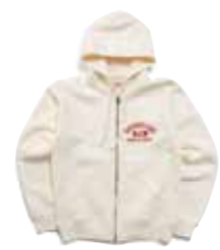
FULL ZIP SWT PARKA EVERGREEN STATE F-CZP-103 ¥22,000 SIZE:S/M/L/XL COLOR:ブラック/ネイビー/ グレー/アイボリー