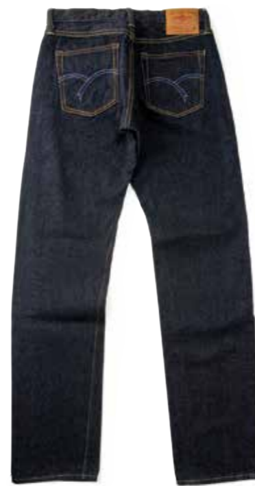
TAPERED ZIPPER 3009Z ¥29,600 SIZE:27-34/36/38 ¥31,400 SIZE:40/42/44 COLOR:ブルー