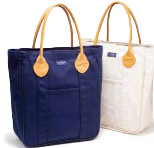
TOTE BAG CL-BA101 ¥15,800 SIZE:H30.4×W53×D20.3cm COLOR:アイボリー/ネイビー