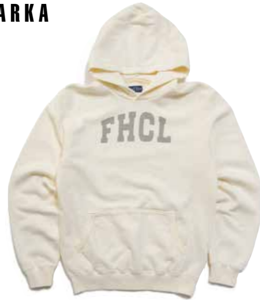
SWEAT PARKA FHCL CL-PS101 ¥13,800 SIZE:S/M/L/XL COLOR:アイボリー/ブラック/ブラウン