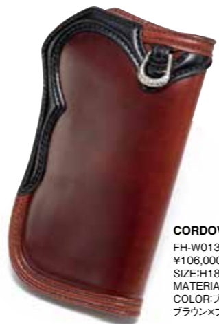
CORDOVAN SEMI LONG WALLET FH-W013 ¥106,000 SIZE:H180×W95mm MATERIAL:CORDOVAN×SILVER COLOR:ブラック/ブラック×ブラウン/ブラウン/ブラウン×ブラック