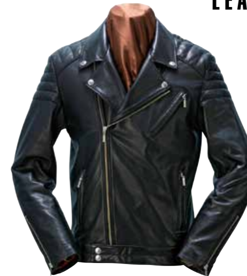
W-RIDERS JACKET CL-LJ001 ¥118,500 SIZE:S/M/L/XL COLOR:ブラック

水染めの牛革を使ったダブルライダースジャケット。ショルダー部分はパッド加工、ライニングは滑りの良いレーヨンを採用する。