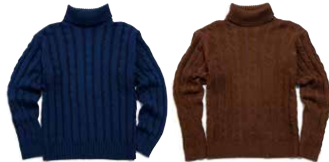
COTTON KNIT TURTLE NECK CL-KT005 ¥19,800 SIZE:S/M/L/XL COLOR:ブラック×チャコール / ネイビー×ブルー / ブラウン×ダークブラウン