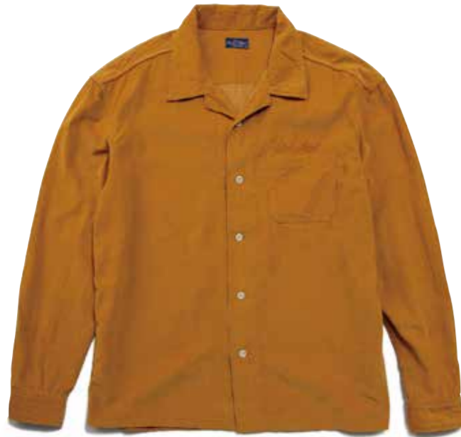
CORDUROY SHIRT CL-SH007 ¥18,800 SIZE:S/M/L/XL COLOR:ブルー/イエロー