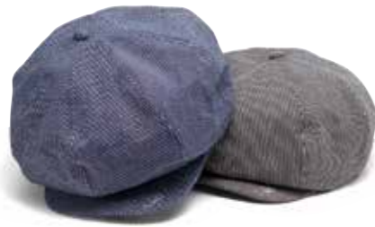
NEWS BOY HAT CL-HC102 ¥8,800 SIZE:S/M/L COLOR:ネイビー/チャコール