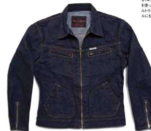
QUILTING ZIP DENIM JKT F-DJ003Z ¥43,800 SIZE:S/M/L ¥45,800 SIZE:XL/XXL COLOR:ブルー

ヨーク&ショルダーやポケットにキルティング加工を施したジップアップ仕様のデニムジャケット。着込んで色落ちするとキルティングが浮かび上がる。