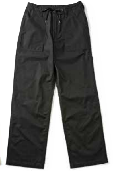
BAKER PANTS WIDE CL-PA002 ¥20,300 SIZE:S/M/L/XL COLOR:オリーブ/ベージュ/ブラック