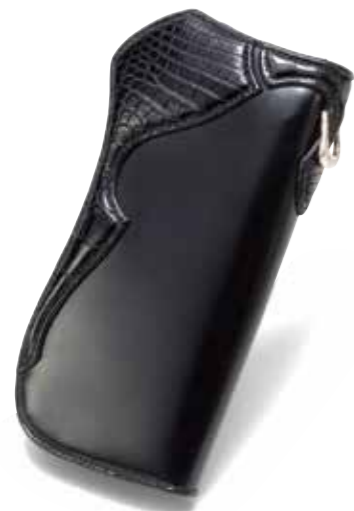
CROCODILE/CORDOVAN LONG WALLET MK-W001 ¥168,000 COLOR:ブラック / ブラウン