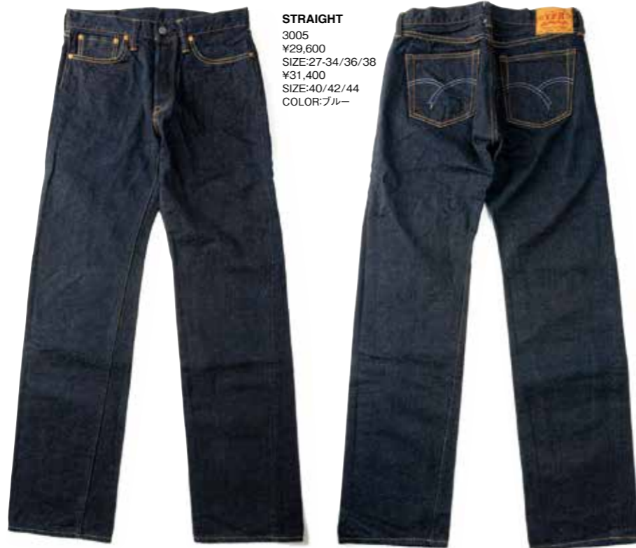
STRAIGHT 3005 ¥29,600 SIZE:27-34/36/38 ¥31,400 SIZE:40/42/44 COLOR:ブルー

ヴィンテージの復刻ではなく、各年代の素晴らしいディテールの集合体とも呼ぶべき完全オリジナルのジーンズ。一見、同じに見えても、日々改良が加えられている進化するベーシックである。ベースとなる生地は世界中のデニム愛好家を魅了し続ける14.5オンスデニム。リベットも一般的なリベットよりも径が大きい完全オリジナル。ウルトラスウェードによる飾りステッチは、ひと目でフラットヘッドとわかる個性的なバックビューを演出。耐久性にもこだわり、フロントポケット口やバックポケットはステッチを二重にして強度を高めている。フラットヘッドの集大成と言って過言ではないジーンズに、ぜひ自分だけのライフスタイルを刻み込んで頂きたい。