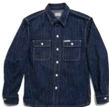
WABASH WORK L/S F-DS702 ¥27,800 SIZE:S/M/L ¥29,900 SIZE:XL/XXL COLOR:ブルー