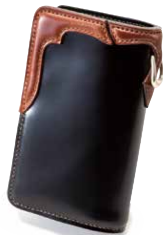
CORDOVAN MEDIUM WALLET FH-WS013 ¥95,000 SIZE:H155×W100mm MATERIAL:CORDOVAN×SILVER COLOR:ブラック×ブラウン