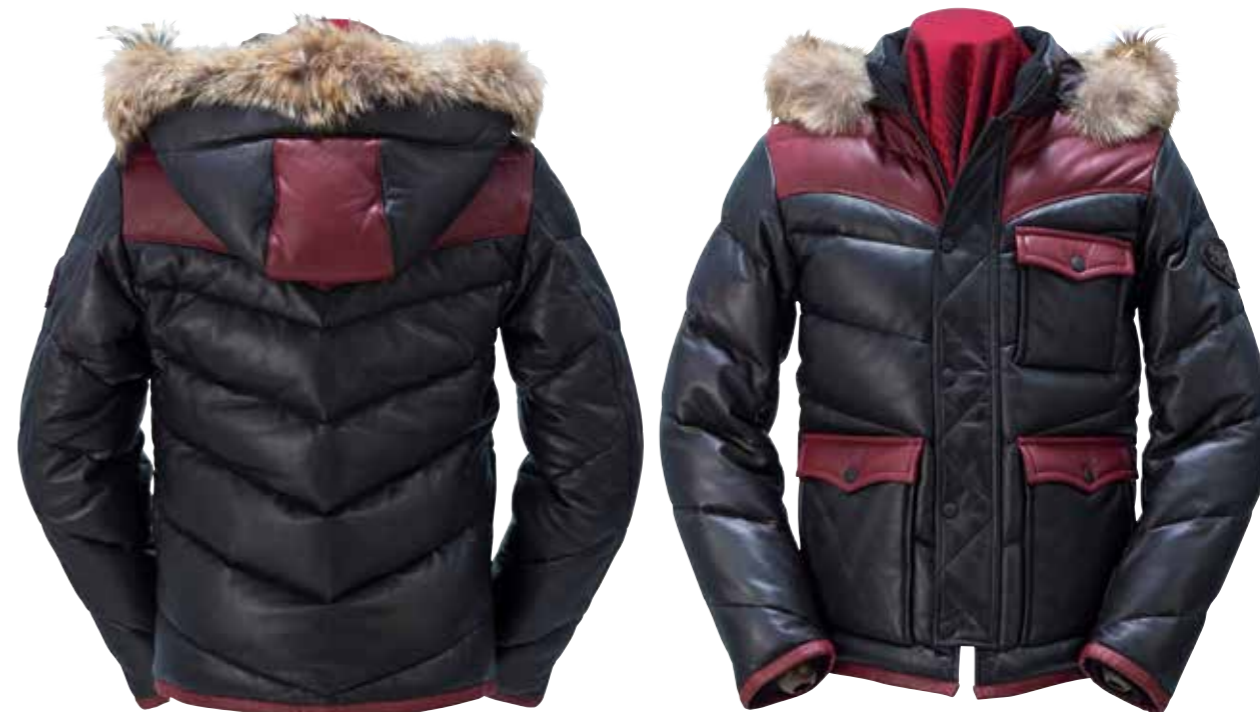
LAMBSKIN DOWN JACKET LD103 ¥324,000 SIZE:36/38/40/42 COLOR:ブラック×ブラック / ブラック×ワイン

ポーランド産マザーグースとシンサレートの組み合わせで高い防寒性と保温性を実現した究極のダウンジャケット。ファーには稀少なコヨーテを採用。受注生産。