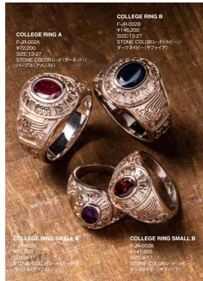
COLLEGE RING A F-JR-002A ¥72,200 SIZE:13-27 STONE COLOR:レッド(ガーネット)/パープル(アメジスト)

馬革の繊維層であるコードバンは皺が付きにくく、シューズに適した素材。コンビパーツにはウルトラスウェードを使い、カジュアルな雰囲気演出。軽量なクレープソールは、疲労軽減、見た目の軽快さにも貢献している。ブラック×ネイビーは数量限定生産。