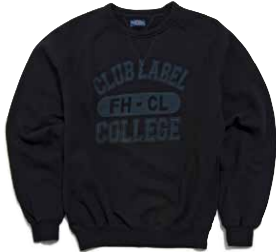
CREW NECK SWEAT COLLEGE CL-SW102 ¥11,800 SIZE:S/M/L/XL COLOR:アイボリー/ブラック/ブラウン