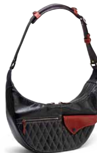
MOON SHOULDER BAG FH-BH005 ¥120,000 SIZE:W400×H200×D100mm MATERIAL:HORSE HIDE COLOR:ブラック×レッド