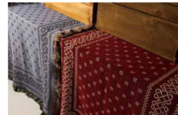
BLANKET BANDANNA CL-ZA001 ¥12,800 SIZE:90×130cm COLOR:ネイビー/グレー/レッド