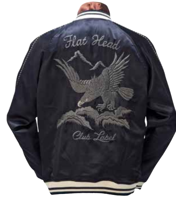
BRITISH SUKAJAN EAGLE CL-OJ004 ¥53,000 SIZE:S/M/L/XL COLOR:ブラック/カーキ

ミリタリーテイスト溢れるデッキジャケット。裏地にフラットヘッドのネル生地、中綿にシンサレートをを使った防寒製の高い1着。