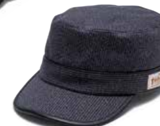
WORK CAP F-HC-006 ¥14,800 SIZE:FREE COLOR:ブラック