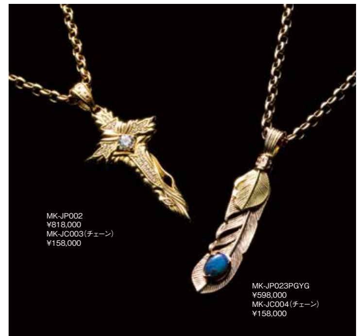
MK-JP002 ¥818,000 MK-JC003 (チェーン) ¥158,000

金属の密度の高さに徹底的にこだわり、さらに「金属を寝かす」という時間の掛かる工程を経て生まれた高級素材を惜しげもなく使ったMKジュエリー。K18YG、K18PG、K18WGをベースに稀少価値の高いブラックオパール、ダイヤモンド、ルビーなどをセットしたジュエリーは、MKレーベルの真骨頂である。