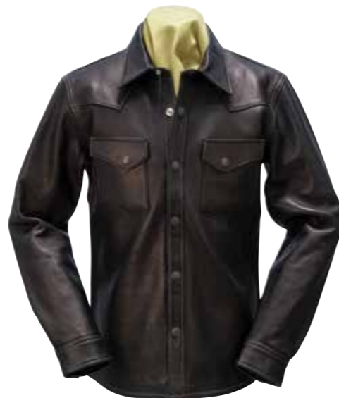
DEER SKIN SHIRT FSD-32KC ¥152,800 SIZE:XS/S/M/L ¥162,800 SIZE:XL/XXL COLOR:ブラック

過去にリリースされていたディアスキンライダースが、素材、デザイン、縫製、すべてにおいてパワーアップして復活。ディアスキンの驚くほどソフトな着心地に驚くはずだ。