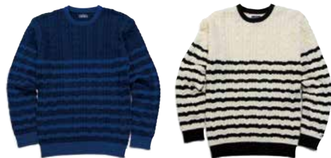
COTTON KNIT CABLE BORDER CL-KT006 ¥19,800 SIZE:S/M/L/XL COLOR:ネイビー×ブルー / アイボリー×ブラック / ネイビー×ボルドー