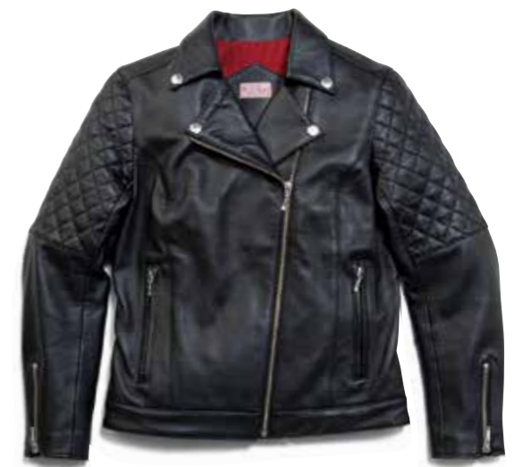
W-RIDERS JACKET LADIES CL-LLJ001 ¥138,000 SIZE:XS/S/M COLOR:ブラック

水染めの牛革を使ったダブルライダースジャケット。ショルダー部分はパッド加工、ライニングは滑りの良いレーヨンを採用する。