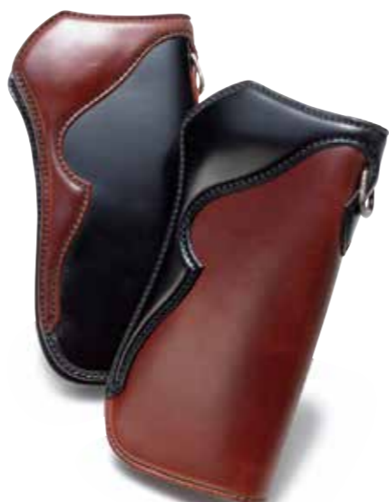
CORDOVAN LONG WALLET FH-W003 ¥111,000 SIZE:H200×W95mm MATERIAL:CORDOVAN×SILVER COLOR:ブラック/ブラック×ブラウン/ブラウン×ブラウン×ブラック