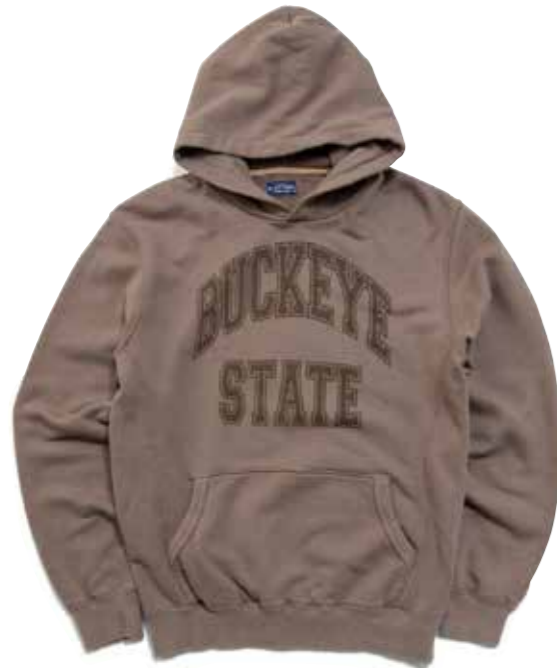
SWEAT PARKA BUCKEYE STATE CL-PS102 ¥13,800 SIZE:S/M/L/XL COLOR:アイボリー/ブラック/ブラウン