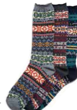
SOCKS SNOW PATTERN SOX-18 ¥1,500 SIZE:FREE COLOR:ブラック/ネイビー/グレー