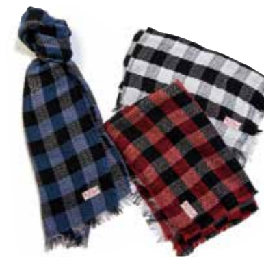
STOLE BLOCK CHECK F-SE002 ¥12,000 SIZE:180×60cm COLOR:ブラック×レッド/ブラック×ネイビー/ブラック×ホワイト