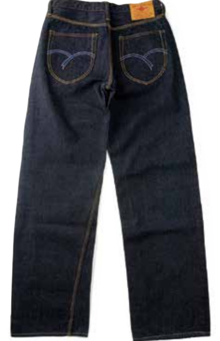
WIDE STRAIGHT PANTS F-WP143 ¥29,600 SIZE:27-34/36/38 ¥31,400 SIZE:40/42/44 COLOR:ブルー