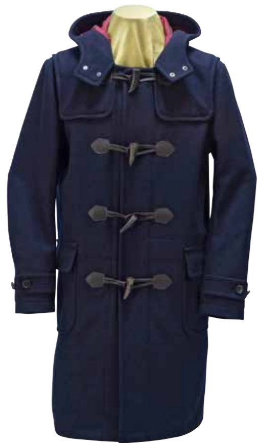
WOOL DUFFLE COAT F-OC301 ¥88,000 SIZE:S/M/L/XL COLOR:ネイビー

イタリアで150年以上の歴史を持つ名門紡績、ゼニアバルファ社のキャッシュウールを使った贅沢なカーディガン。頭を中心として円を描くように編んでいく求心編みによって、縦横ではなく斜め方向に伸縮するため非常に着心地が良い。