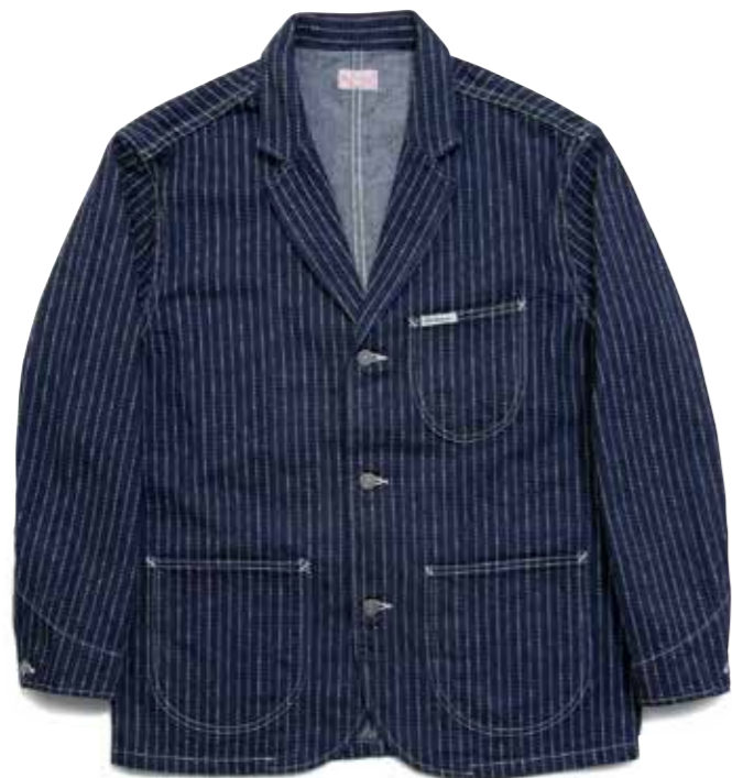
WABASH JKT F-DJ701 ¥39,800 SIZE:S/M/L ¥41,800 SIZE:XL/XXL COLOR:ブルー

旧式シャトル織機で織り上げた12オンスデニムに、抜染によるドットストライプを施したウォッシュデニム。 着込むことでデニムのタテ落ちと抜染プリントの風合い、両方を楽しめるデニム愛好家にはたまらないアイテムである。