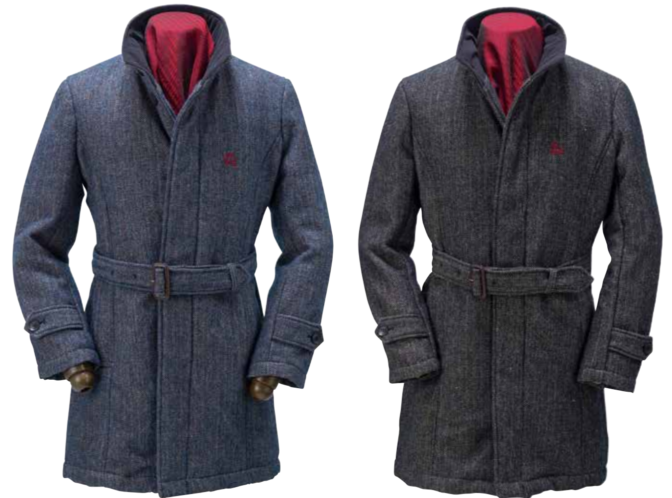
WOOL STAND COLLAR COAT R-OVJ-001 ¥88,000 SIZE:S/M/L/XL COLOR:ブラック/ブルー

ウールの保温性と麻の程よい粗野感を組み合わせた風合いのある生地を使ったスタンドカラーコート。中綿に軽量のシンサレートを使うことで保温性を確保している。襟元には肌に優しいウルトラスウェードを採用。