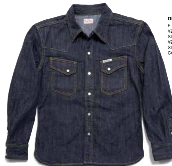
DENIM WESTERN L/S F-DS003 ¥23,000 SIZE:XS/S/M/L ¥25,000 SIZE:XL/XXL COLOR:ブルー

ブランド設立時から展開し続けているタイト&ショートデニムシャツ。50年以上前のヴィンテージのシルエットは、決して現代のスタイルにマッチするとは言い難い。ヴィンテージに敬意を払いつつも、現代のファッションにマッチしたモノ作りをモットーとするフラットヘッド。このデニムシャツはフラットヘッドのアイデンティティ、そのものなのだ。