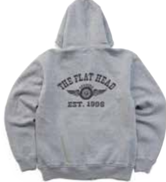
FULL ZIP SWT PARKA FH FLYING WHEEL F-CZP-101 ¥22,000 SIZE:S/M/L/XL COLOR:ブラック/ネイビー/ グレー/アイボリー