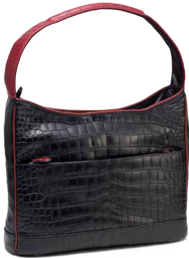
CROCODILE BAG MK-B001 SP ¥1,280,000 COLOR:ブラック×レッド