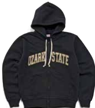
FULL ZIP SWT PARKA OZARK STATE F-CZP-102 ¥22,000 SIZE:S/M/L/XL COLOR:ブラック/ネイビー/グレー/ アイボリー