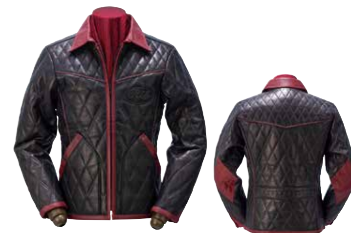
LAMBSKIN DIAMOND QUILTING JACKET NJ101E ¥351,800 SIZE:36/38/40/42 COLOR:ブラック / ブラック×ワイン

胸元にブランドロゴをデザインしたレザーパッチを縫い付けたキルティングジャケット。受注生産。