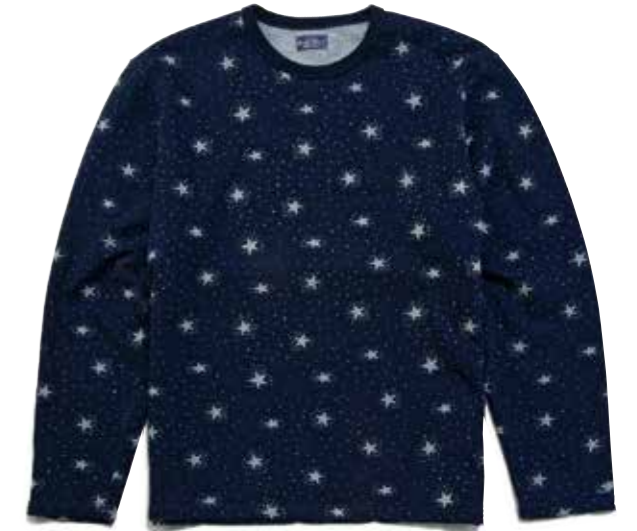
INDIGO SWEAT CREW NECK CL-SW201 ¥12,800 SIZE:S/M/L/XL COLOR:ブルー クラブレーベルの遊び心を体現したボディの星柄デザインは抜染プリントによって表現されている。