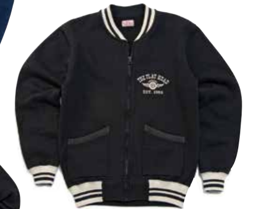
FULL ZIP SWT JKT FH FLYING WHEEL F-CZR-201 ¥21,000 SIZE:S/M/L/XL COLOR:ブラック/ネイビー/グレー/アイボリー

肩の部分にハギがなく1枚で仕立てられたスノーパターン部を、高度な技術で縫製したフルジップ仕様の雪柄スウェット。柄の見え方にこだわったディテールである。