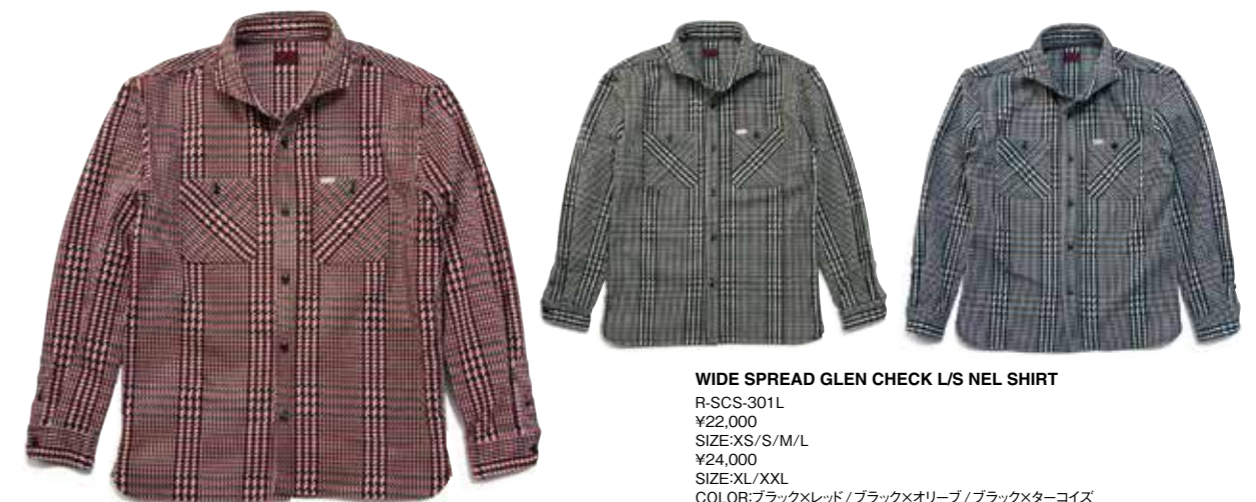
WIDE SPREAD GLEN CHECK L/S NEL SHIRT

ウールの保温性と麻の程よい粗野感を組み合わせた風合いのある生地を使ったスタンドカラーコート。中綿に軽量のシンサレートを使うことで保温性を確保している。襟元には肌に優しいウルトラスウェードを採用。