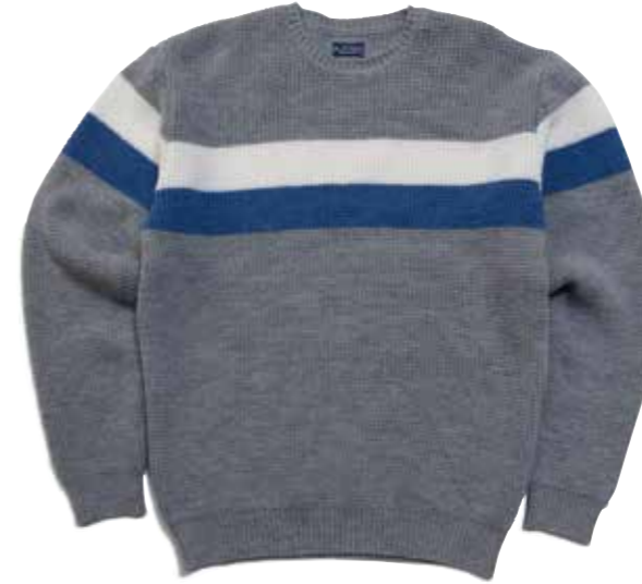
WOOL-KNIT LINE BORDER CREW NECK CL-KT007 ¥20,000 SIZE:S/M/L/XL COLOR:ブルー / グレー / アイボリー