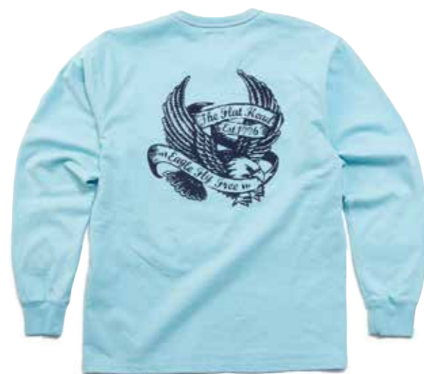
THC LONG SLEEVE EAGLE FLY FREE F-THCL-209 ¥10,000 SIZE:XS/S/M/L ¥11,000 SIZE:XL/XXL COLOR:ホワイト/ブラック/ ネイビー/サックス