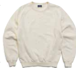
CREW NECK SWEAT CL-SW101 ¥9,800 SIZE:S/M/L/XL COLOR:アイボリー/ブラック/ブラウン