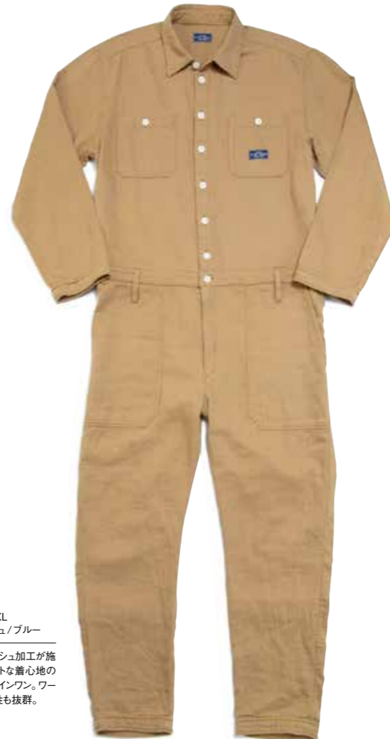
ALL IN ONE CL-CWP001 ¥28,000 SIZE:S/M/L/XL COLOR:ベージュ/ブルー

特殊ロングウォッシュ加工が施され、非常にソフトな着心地のコットン製オールインワン。ワークブーツとの相性も抜群。