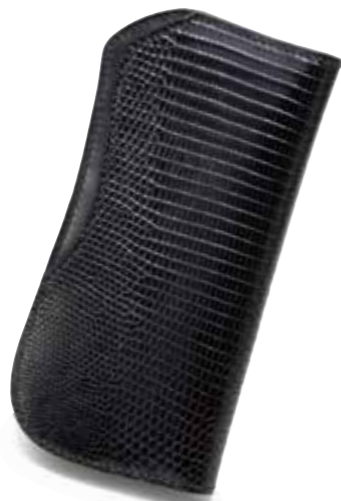
LIZARD/CORDOVAN/BOX KIP LONG WALLET TL-W002SP ¥80,000 COLOR:ブラック