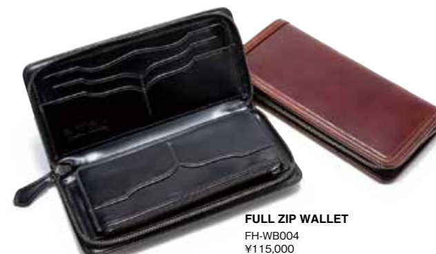
FULL ZIP WALLET FH-WB004 ¥115,000 SIZE:H218×W110mm MATERIAL:CORDOVAN(外装)×多脂革(内装) COLOR:ブラック/ブラウン