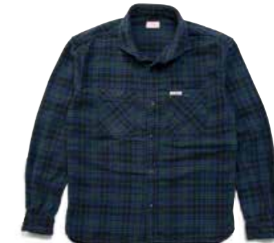
WIDE SPREAD FH CHECK NEL L/S F-SNO-304L ¥23,000 SIZE:XS/S/M/L ¥25,000 SIZE:XL/XXL COLOR:ネイビー×アイボリー/ ブラック×グリーン

ヘリンボンとチェック柄を組み合わせたネル生地を使い、フォーマルシャツに使われるワイドスプレッドカラーを組み合わせたシャツ。首元でお洒落を演出する。