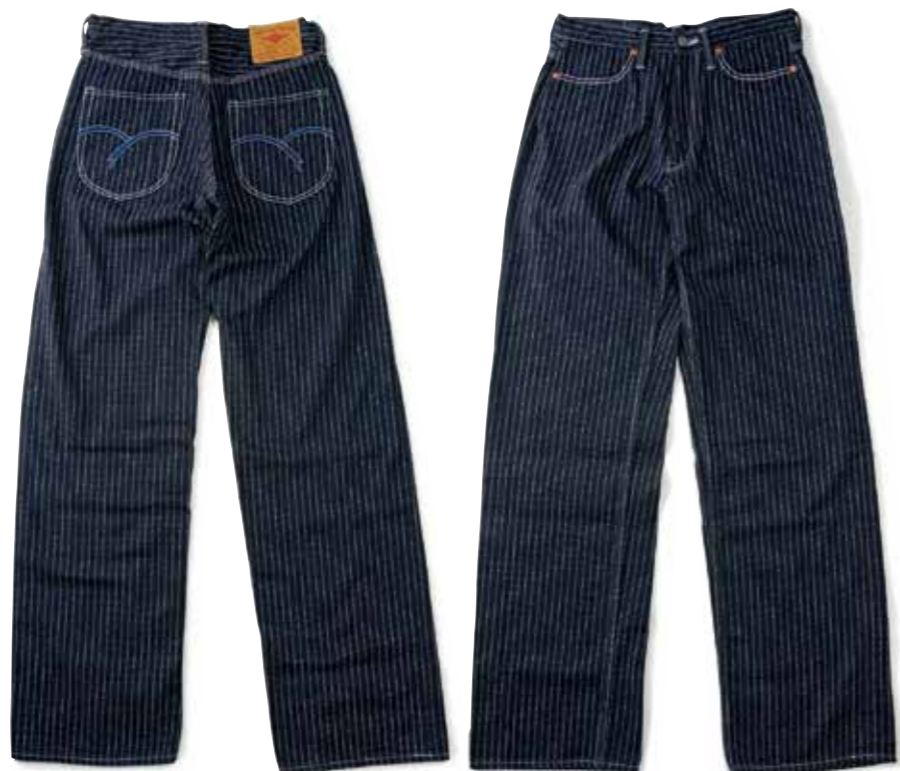
WABASH WIDE STRAIGHT PANTS F-WP703 ¥32,400 SIZE:29-34/36/38 ¥34,200 SIZE:40/42/44 COLOR:ブルー

股上が深いワイドストレートシルエットのウォッシュパンツ。主要部はトリプルステッチ、ポケット部は特殊二重ステッチで補強している。飾りステッチはウルトラスウェード、革パッチはゴート製だ。