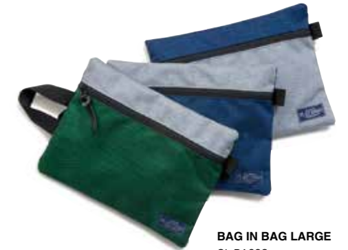
BAG IN BAG LARGE CL-BA003 ¥2,700 SIZE:H21×W27cm COLOR:ブルー/グリーン/グレー