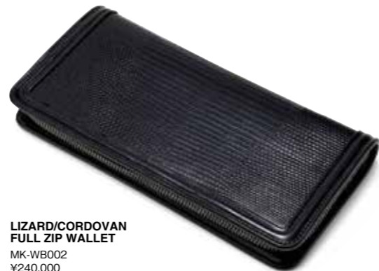
LIZARD/CORDOVAN FULL ZIP WALLET MK-WB002 ¥240,000 COLOR:ブラック