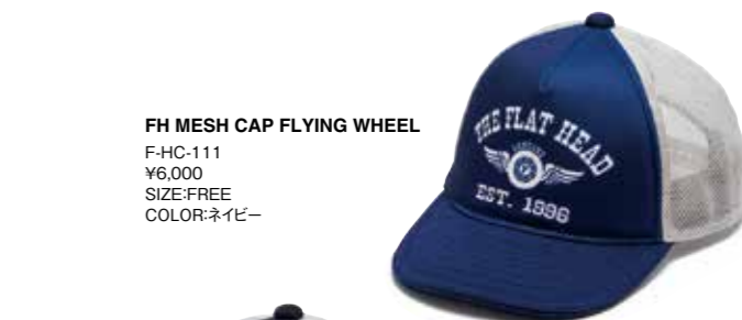
FH MESH CAP FLYING WHEEL F-HC-111 ¥6,000 SIZE:FREE COLOR:ネイビー