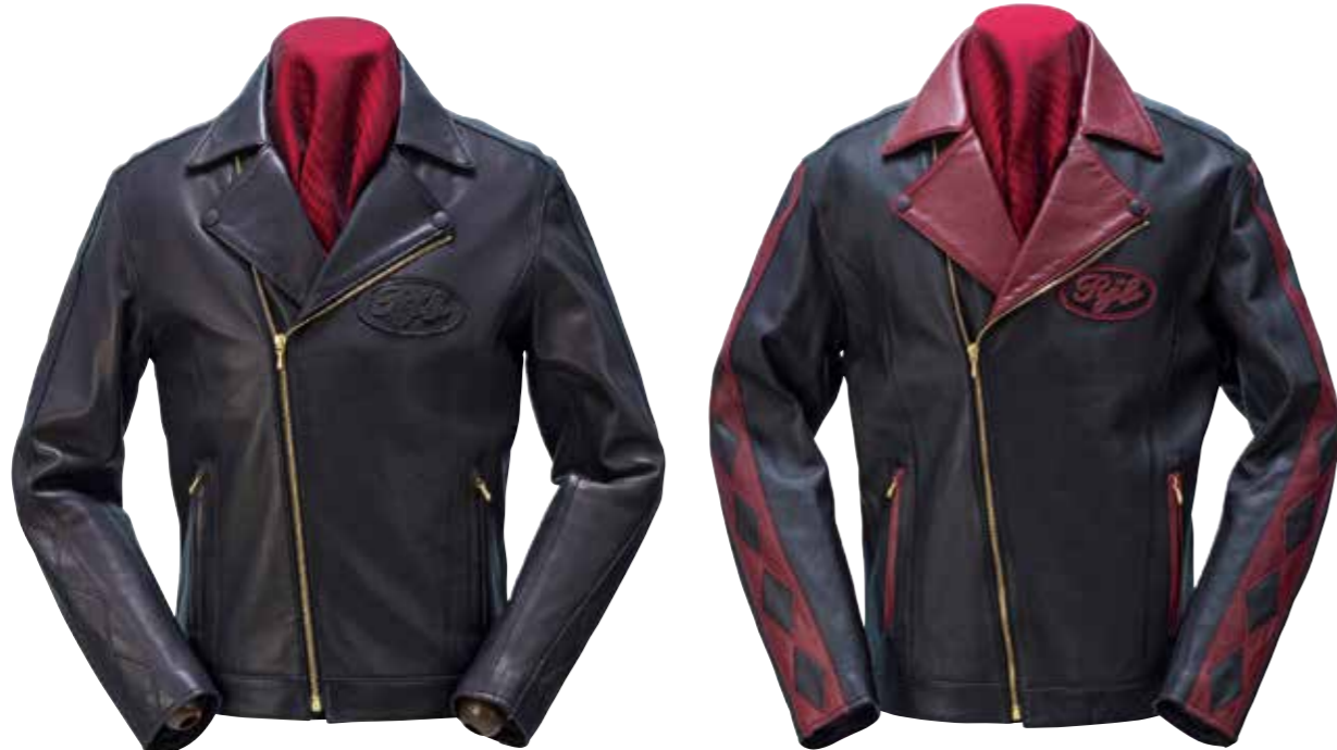
LAMBSKIN W-RIDERS JACKET LJ302 ¥240,700 SIZE:34/36/38/40/42 COLOR:ブラック / ブラック×ワイン

レザージャケット特有の重さや硬さによるストレスがほとんどなく、快適に着用可能なラムスキン。 他の革素材と比べ採取量が少なく、原皮は非常に稀少で高額だが、R.J.Bが求める極上のスタイル&着心地には欠かせない革である。 中綿にシンサレートを挟み込むことで、薄手ながら高い保温性も確保している。