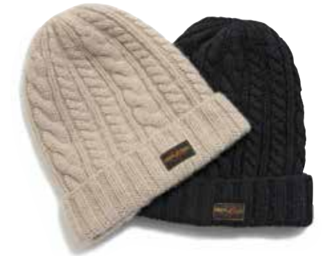
HAND KNITTING CAP

繊維の宝石と呼ばれるカシミアと高級毛皮で有名なセーブルを使い、職人の手編みによって完成したタートルネックニット。今まで経験したことのない着心地と保温性を体感できる。