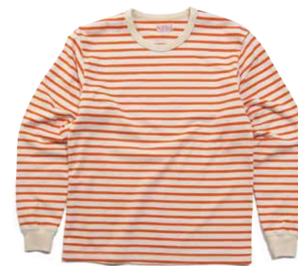
L/S T-SHIRT BORDER B F-BTL-102 ¥7,800 SIZE:S/M/L/XL COLOR:アイボリー×オレンジ/アイボリー×ブルー/ ブラック×アイボリー