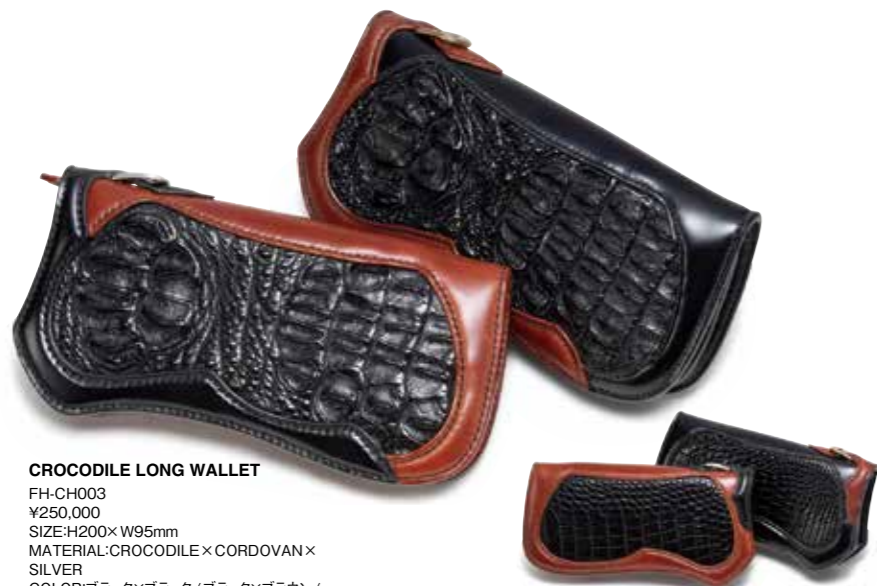
CROCODILE LONG WALLET FH-CH003 ¥250,000 SIZE:H200×W95mm MATERIAL:CROCODILE×CORDOVAN×SILVER COLOR:ブラック×ブラック/ブラック×ブラウン/ブラウン×ブラック